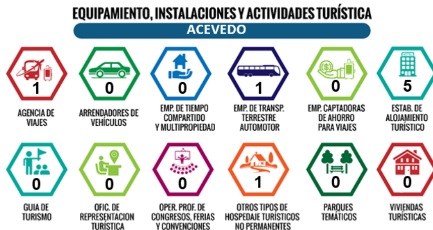
Ilustración 6 Equipamiento, Instalaciones y Actividades Turísticas