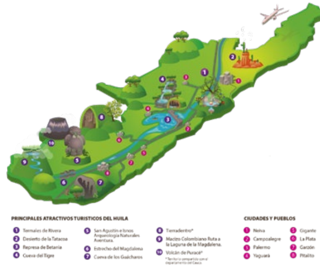
Ilustración 1. Principales Atractivos del Huila