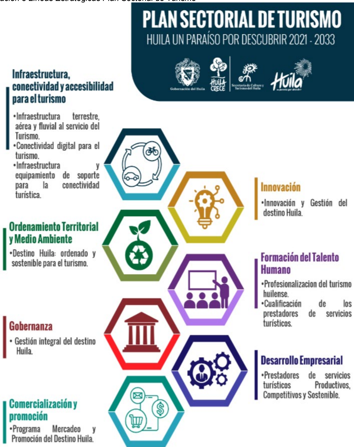
Ilustración 3 Líneas Estratégicas Plan Sectorial de Turismo