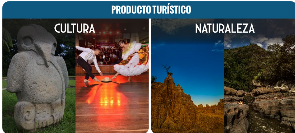
Ilustración 2.Producto Turístico del Huila