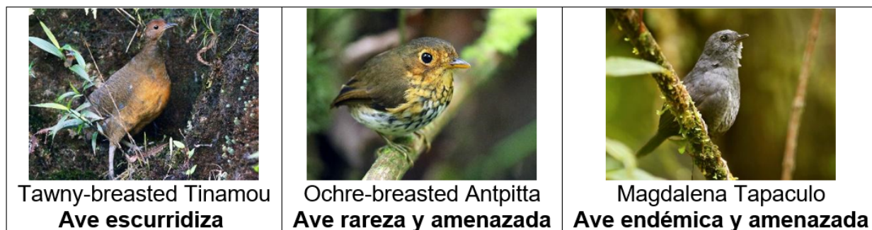
Ilustración 5 Especies interesantes se encuentran

Como se mencionó anteriormente, en la Reserva Natural Tarpeya la investigación sobre la avifauna es casi nula, de ahí que no se tenga un amplio registro de las especies. Sin embargo, con las jornadas de caracterización realizadas por la gobernación del Huila – que dan cuenta de 74 especies –, se han hallado algunas de gran importancia y que exigen altas condiciones de conservación. Este hecho lleva a pensar que existe un enorme potencial para la investigación científica y para el turismo de observación de aves.