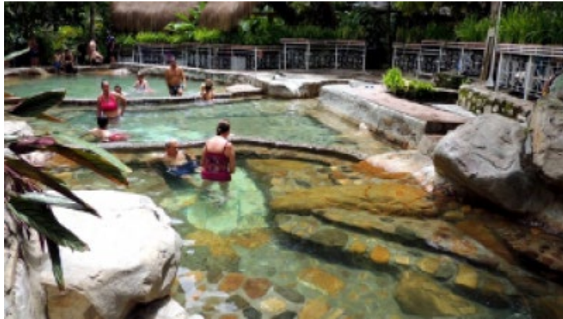
Ilustración 13: Termal los Ángeles

Termal Los Ángeles: Baños termal diseñado con elementos naturales con temperaturas que van desde los 42 grados centígrados a los 28 grados centígrados. Son aguas sulfatadas con un ph de 7.5 la temperatura en el afloramiento es de 56° centígrados. Estas termales están divididas en piscinas de piedra simulando una quebrada natural en su alrededor es posible encontrar jardines de heliconias.