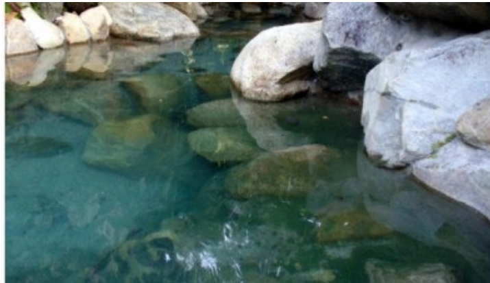
Ilustración 8: Fuentes de Aguas Termales: