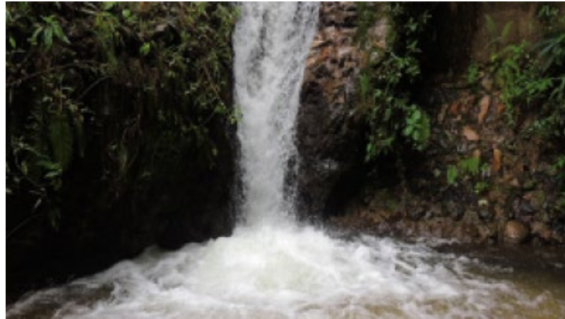
Ilustración 7: Cascadas El Santuario:

Cascada el Santuario: Conformadas por la fuente hídrica de la quebrada la Honda en una serie de 4 cascadas de entre 3 y 6 metros de altura rodeada se matorrales y especies propias del clima cálido. Se accede a la primera cascada desde el sendero más a las demás caídas de agua se accede por los muros que se habilitaron para el riego de los cultivos la última cascada es necesario ir con un guía experto y equipo de cuerdas por el nivel de su pendiente.