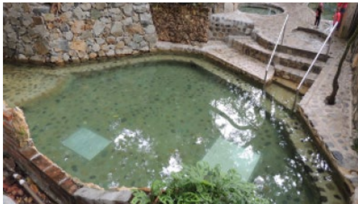
Ilustración 14: Termal San Francisco

Termal San Francisco: Fuente y piscina de aguas termales rodeada de naturaleza y explotaciones agropecuarias las piscinas son empedradas y existen diferentes ambientes y temperaturas las aguas tiene altos contenidos minerales están ubicadas en un predio de cerca de 20 hectáreas. La fuente de agua termal proviene de aguas subterráneas impulsadas por el movimiento de las placas tectónicas de una falla en la cordillera oriental son aguas magmáticas mineralizadas. La temperatura del agua oscila entre 38 y 45 grados centígrados.