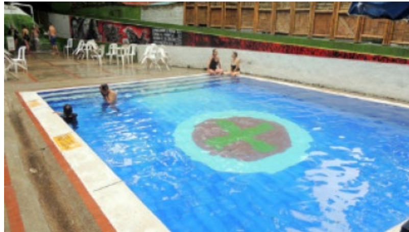
Ilustración 15: Termal San Francisco

Termales Tierra de Promisión: Fuente de aguas termales que proviene de aguas subterráneas impulsadas por el movimiento de las placas tectónicas de una falla en la cordillera oriental son aguas magmáticas mineralizadas. La tempera del arroyo es 48 grados y de la piscina 42 grados. Contiene minerales como arsénico boro bromo cobre y nitrógeno cloruros bicarbonatos sales y aguas sulfatadas.