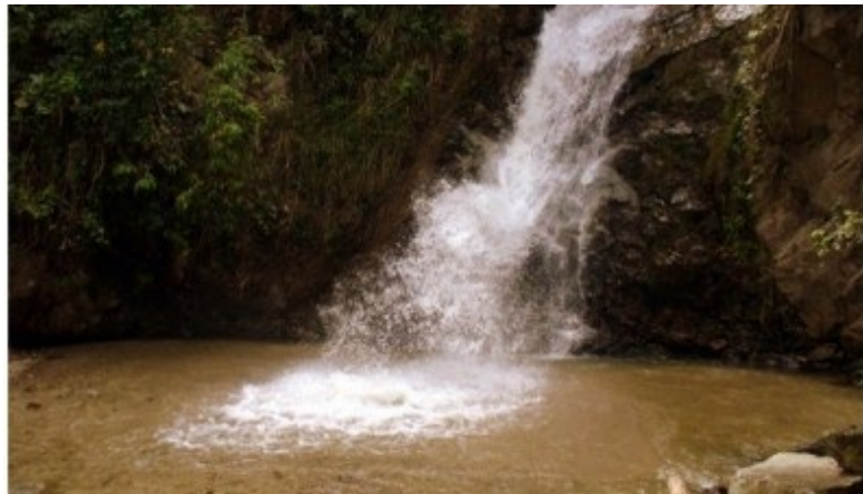
Ilustración 6: Cascada Salto Del Ángel

Cascada Salto Del Ángel: Sendero interpretativo con componentes agrícolas, históricos y culturales, que tiene como eje central una cascada ubicada en un cañón, en la quebrada Agua Fría donde se pueden desarrollar actividades de cuerdas, escalada libre y otras actividades recreativas. En el recorrido se pueden apreciar algunas construcciones coloniales y republicanas, viviendas campesinas en bahareque y techo de palma, diversos cultivos, ganado; y fauna y flora silvestre. El circuito se puede hacer pasando por alguno de los sitios de aguas termales.