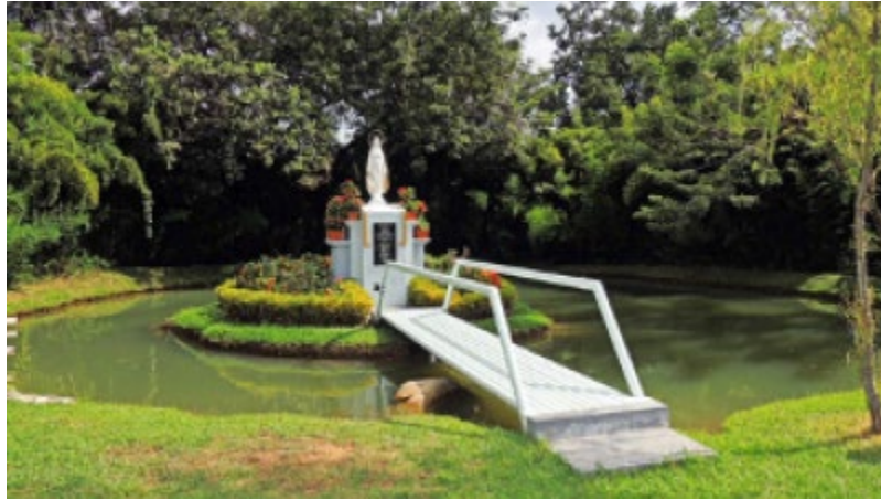
Ilustración 11: Seminario Mayor de San Esteban