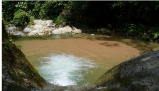
Ilustración 10: Quebrada la Medina, Sendero la Bocana

Quebrada la Medina, Sendero la Bocana: Sendero que inicia en el centro poblado del Corregimiento de la Ulloa, donde en el primer tramo se pueden observar, la arquitectura campesina, y las explotaciones agropecuarias, para tomar luego la quebrada la Medina aguas arriba pasando por piscinas naturales, cascadas y fuentes de agua que brotan en los peñascos a los lados de la quebrada Hay mucha diversidad Biológica. Nacimientos de agua azufrada que caen a la quebrada aclaran el agua mejorando la percepción Visual y la dificultad del sendero lo hace muy emocionante.