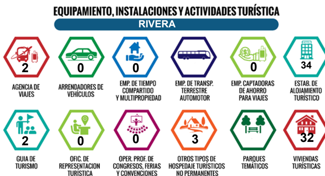
Ilustración 17. Equipamiento, instalaciones y actividades turísticas