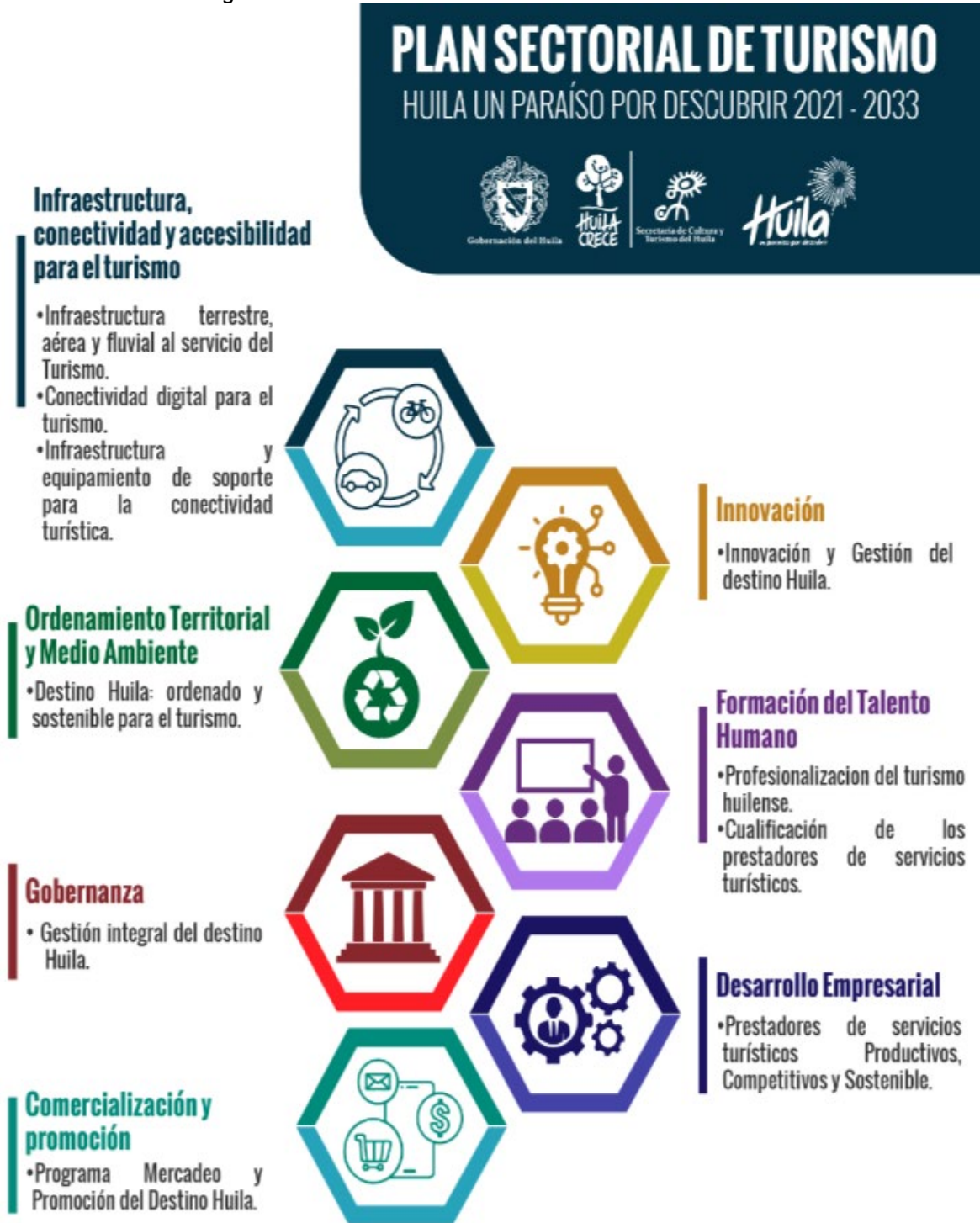
Ilustración 3 Líneas Estratégicas Plan Sectorial de Turismo